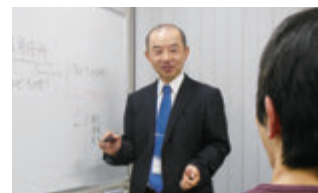
少人数制のEYEだから個別にしっかりと対応!

EYEでは面接カードの書き方や、面接における受答えの内容の相談などマンツーマンであなたに合わせた指導をします(予約制)。また、論文についても書いたものを口頭指導します(添削無制限ではありません)。