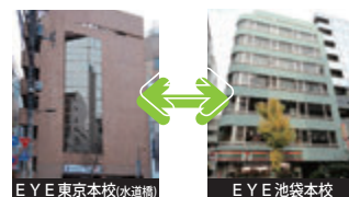
EYE東京本校(水道橋) EYE池袋本校 EYEはすべての校舎の利用が可能です!

申込校舎以外の自習室・ブース室の利用、個別相談も可能です。受講証を持参していれば手続きは一切不要です。