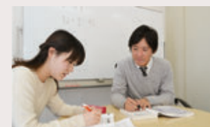
あなたの能力に合わせた個別授業を行います!