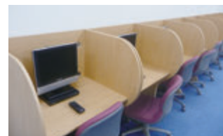
DVD個別ブースは予約不要で利用しやすい!

通常、1回4時間あたり500円のEYE校舎内設置のDVD個別ブース利用(欠席補講用・復習用)が無制限無料で使用できます。また、EYEではDVDブース利用の事前予約が一切いらないため利用時間内でしたらいつでもご利用頂けます。